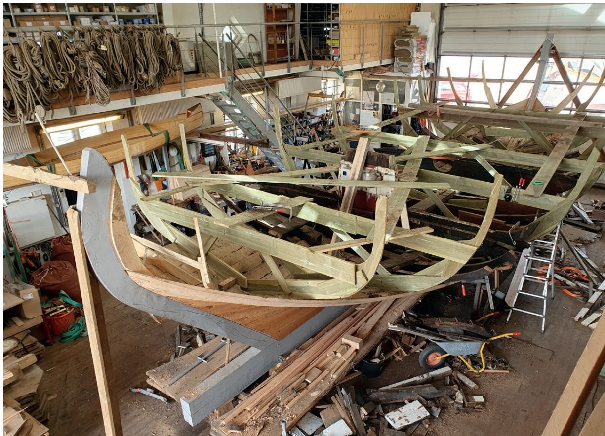
Resten af den gamle klædning, dækket og ruffene er taget ud af Otto.