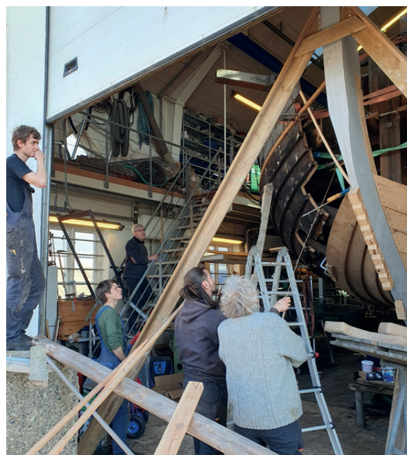
Bordenes forløb op til stævnen diskuteres.

Havbådehuset er almindeligvis åbent i arbejdstiden