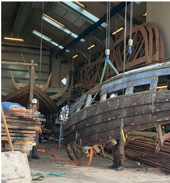
En del af Otto er skåret fri.