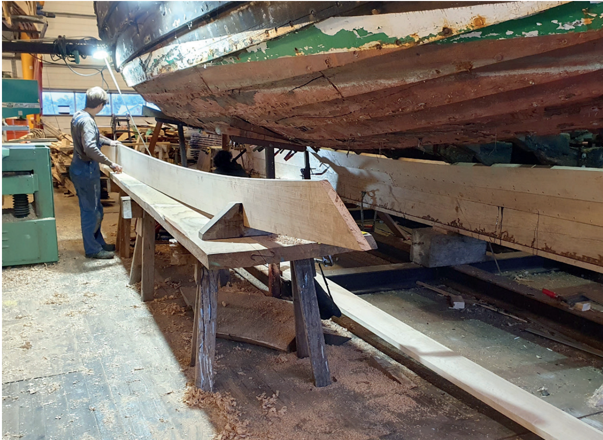
De gamle bord skæres fri efterhånden, som de nye sættes i.

Da der var kommet ni nye bord i hver side, blev der sat skabeloner op, så bådebyggerne, når de resterende bord blev taget ud, stadig kan se, hvordan faconen har været. Derefter er hele den øverste del af skibet taget væk og stillet udenfor.